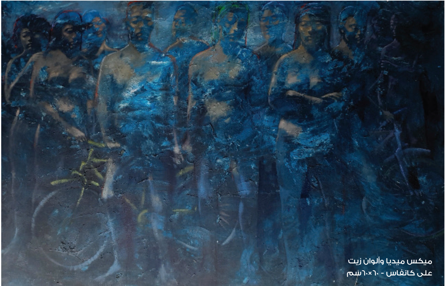
ميكس ميديا وألوان زيت على كانباس - ٦٠×٦٠سم