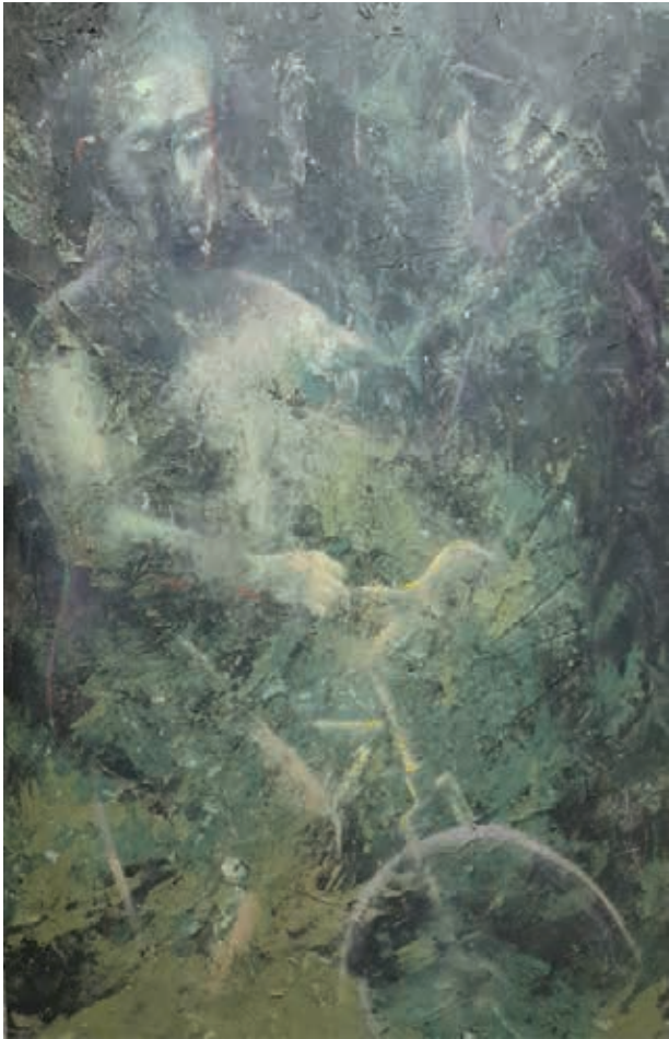
ميكس ميديا وألوان زيت على كانفاس - ٣٠٠x١٠٠سم