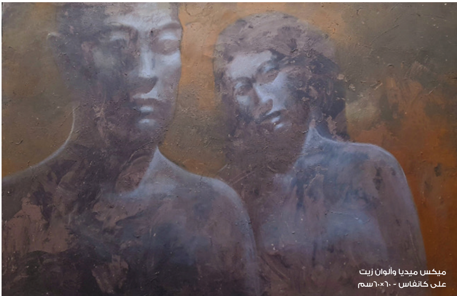
ميكس ميديا وألوان زيت على كانفاس - ٦٠×٦٠ سم