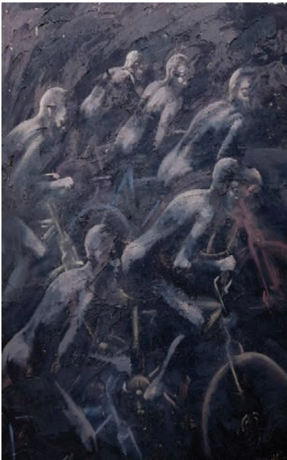
ميكس ميديا وألوان زيت على كانفاس - ١٥٠×٢٠٠ سم