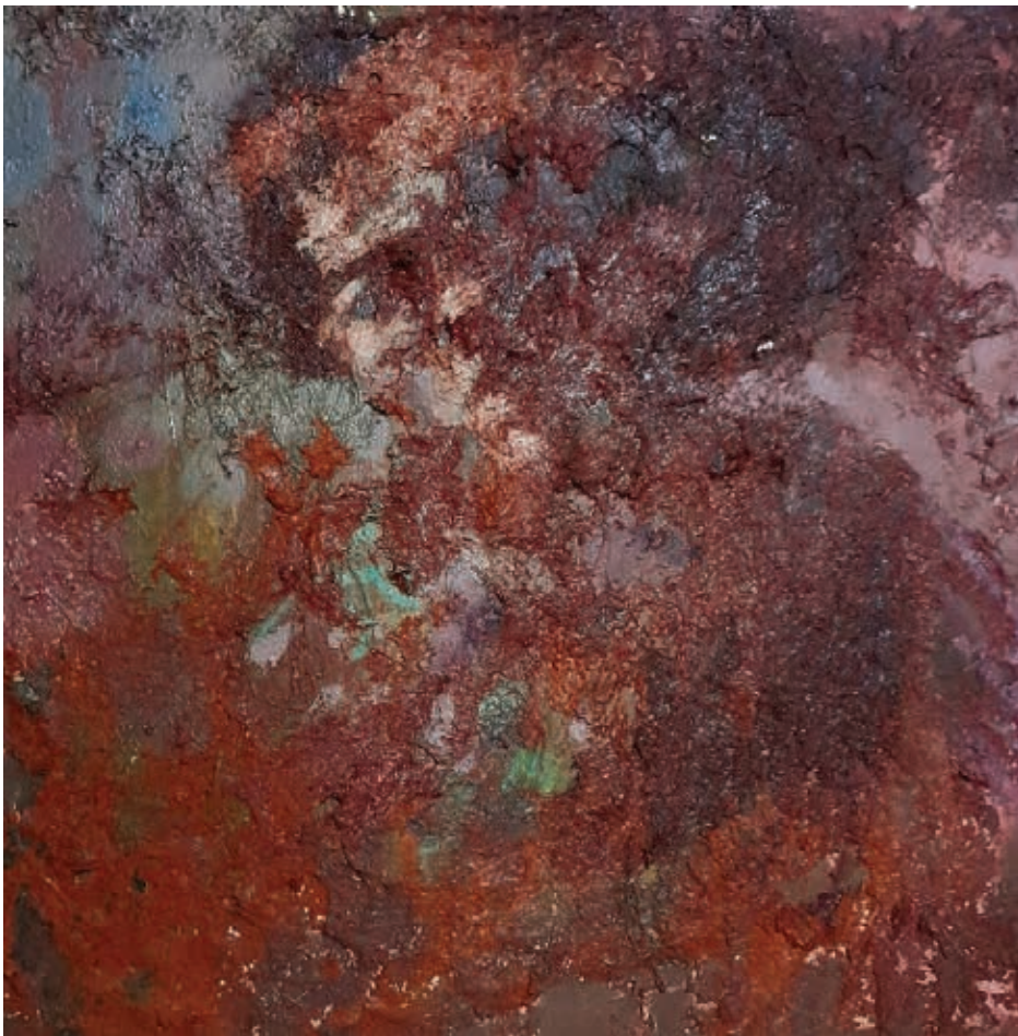
ميكس ميديا او ألوان زيت على كانفاس - ٦٠×٦٠ سم