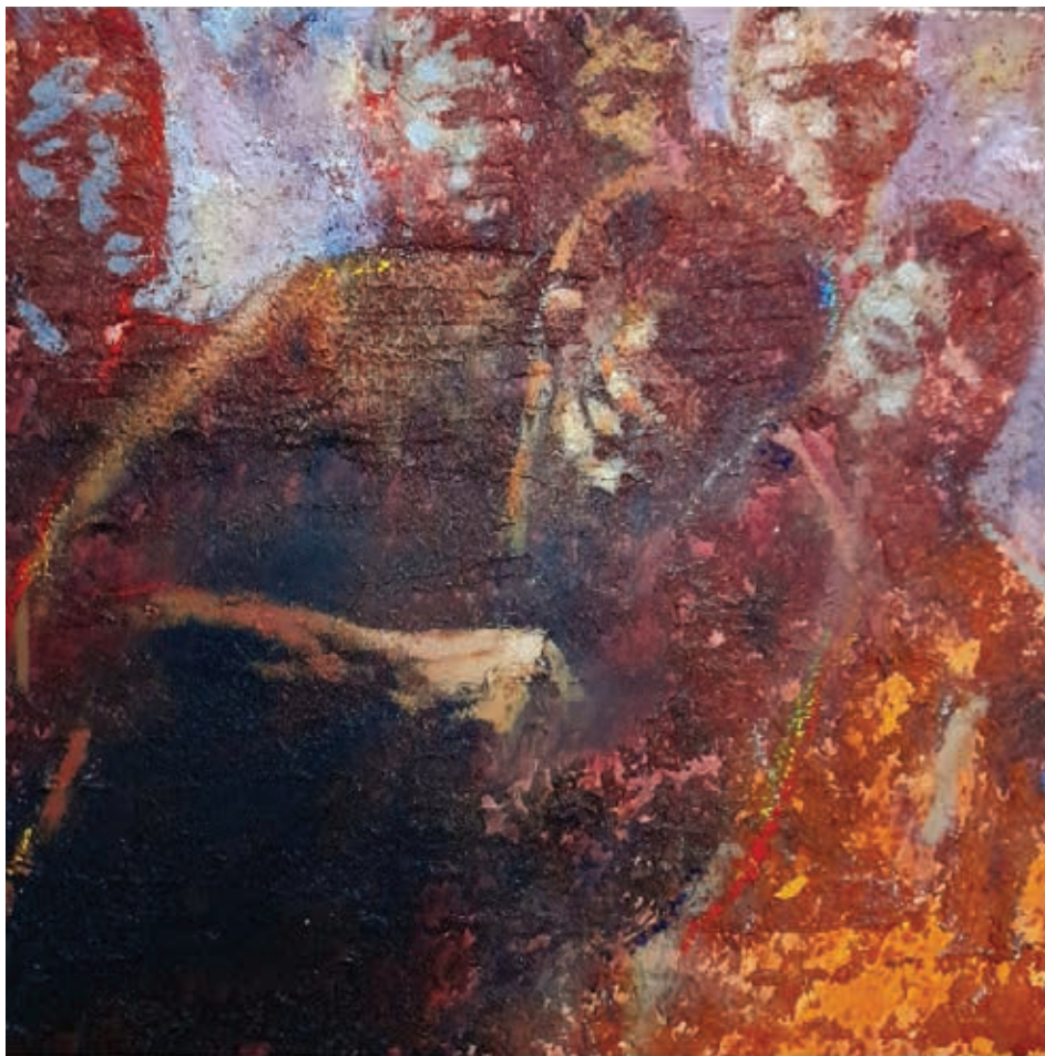
ميكس ميديا وألوان زيت على كانفاس - ٣٠٠×٢٠٠سم