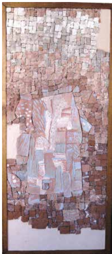
2014 - 52 x 62 cm