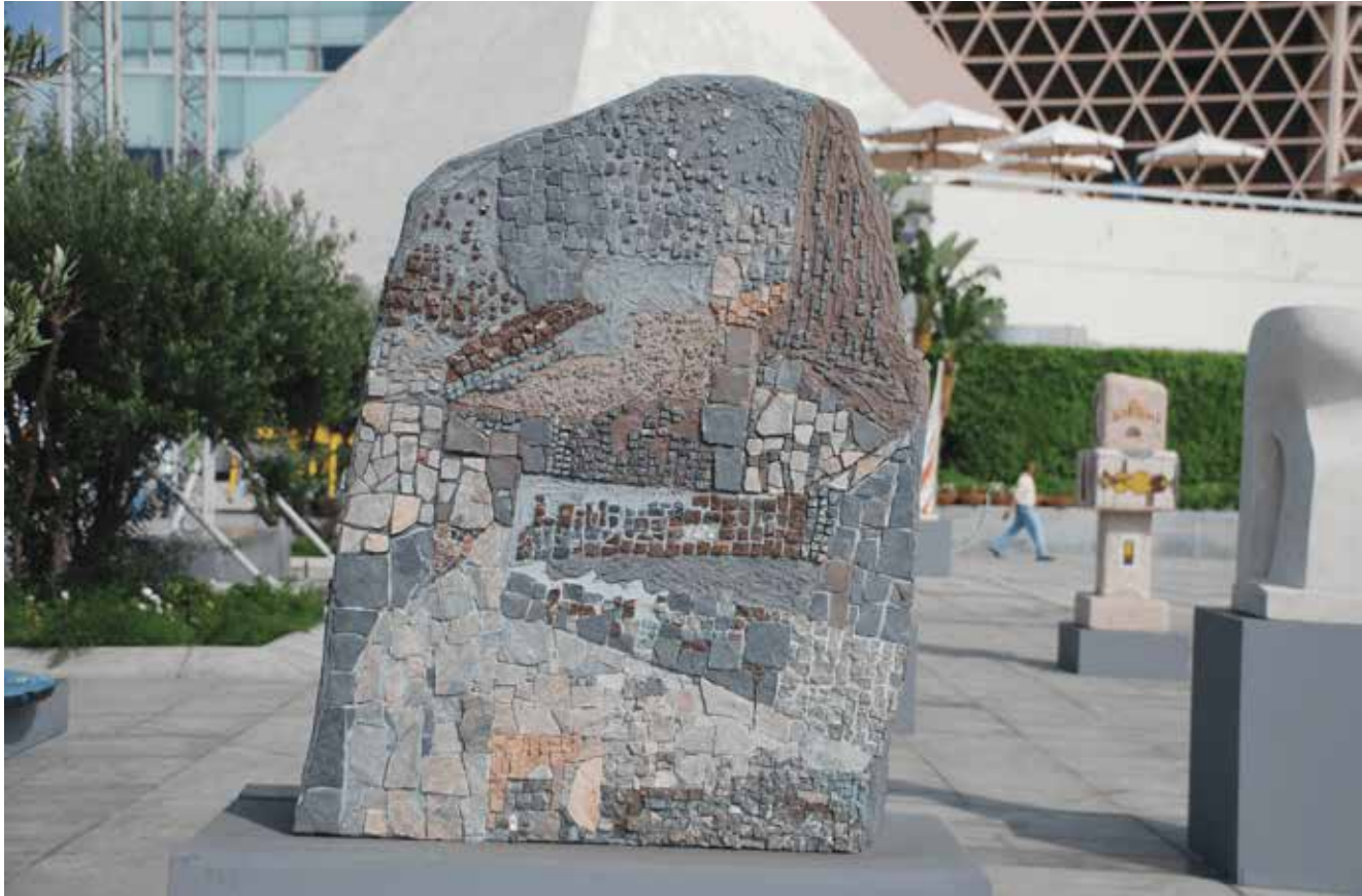
3d Mosaic Symposium - 2009_