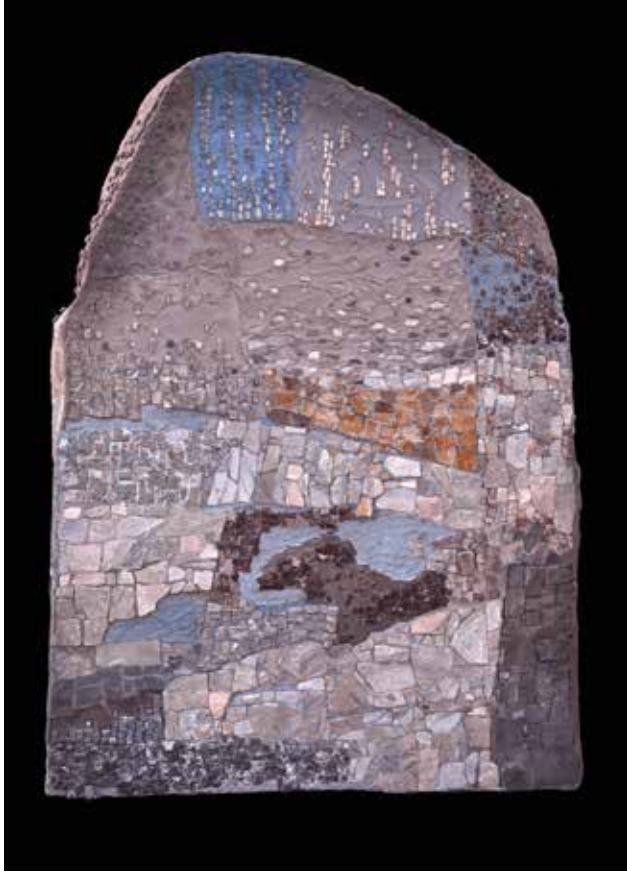
3d Mosaic Symposium - 2009- 80 x 120 cm