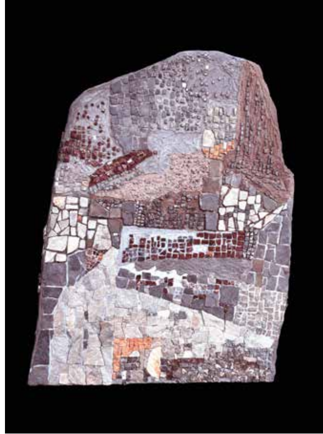
3d Mosaic Symposium - 2009- (2)80 x 120 cm