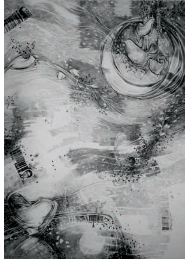
أمواج رقرقة ٧٠×٥٠ سم أقلام جاف على ورق أبيض Sparkling waves Dry pen on white paper