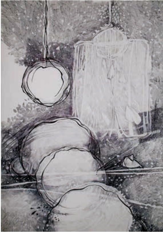
Eternal dry pen on white paper سرمديّة أقلام جاف على ورق أبيض ٣٥ × ٥٥ سم