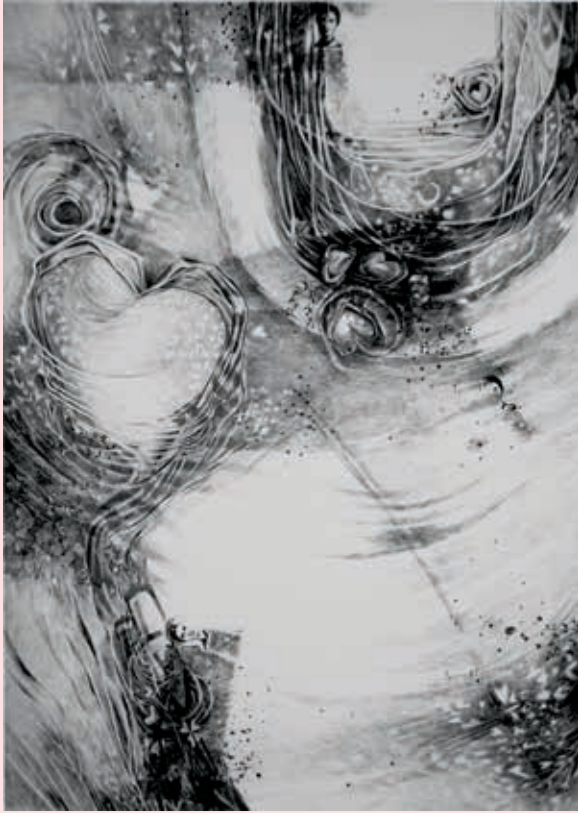
Aspiring Hearts dry pen on white paper

قلوب متطلعة أقلام جاف على ورق أبيض ٧٠ × ٥٠ سم