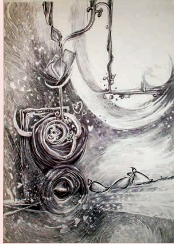
Insight of the Heart dry pen on white paper

قلوب متطلعة أقلام جاف على ورق أبيض ٧٠ × ٥٠ سم