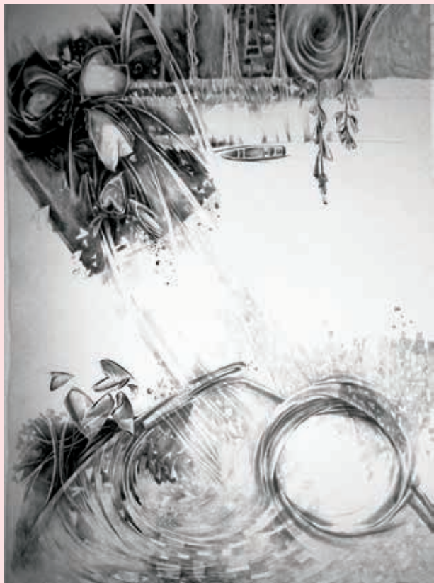
Potential Energy dry pen on white paper

طاقة كامنة أقلام جاف على ورق أبيض ٧٠ × ٥٠ سم