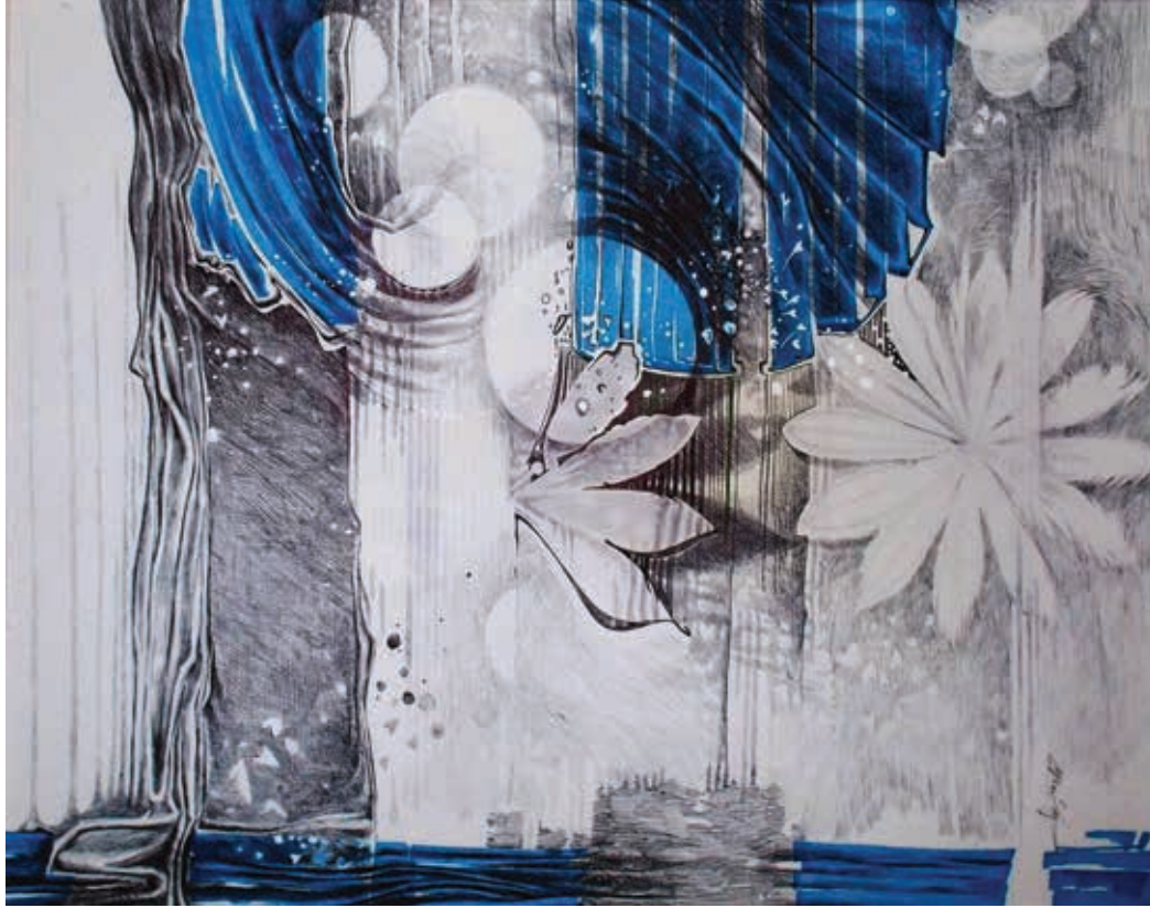
Birth of a Soul