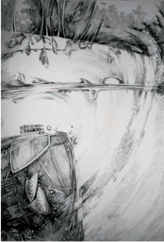
دروب ٧٠×٥٠ سم أقلام جاف على ورق أبيض Paths Dry pen on white paper