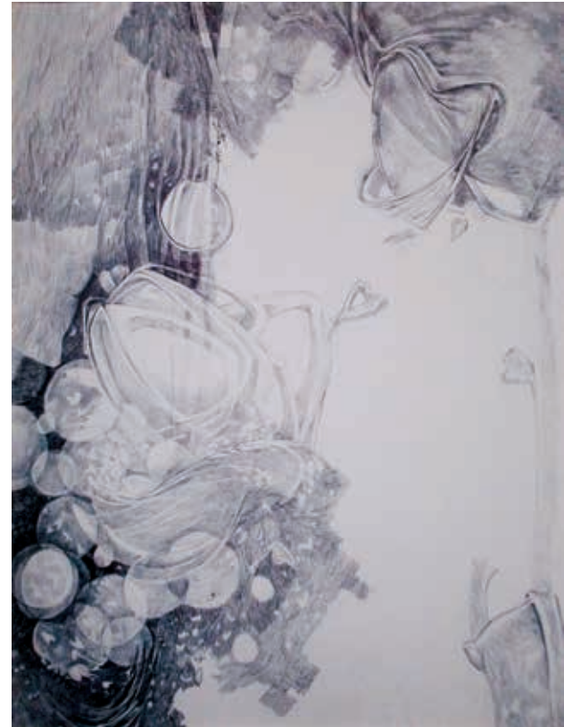
Absence dry erase pen on white paper غياب أقلام جاف على ورق أبيض ٧٠ × ٥٠ سم