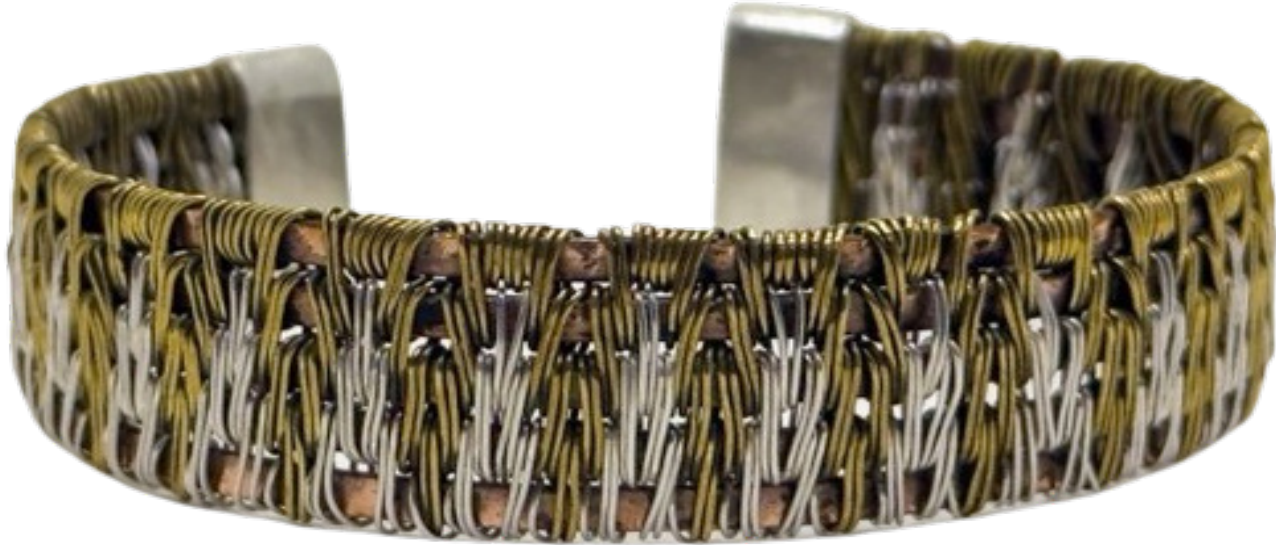
أسورة - فضة ونحاس اصفر وأحمر، كسر احجار - ١,٤×٦×٥ سم - ٢٠٢٣

مواليد ١٩٨٦، بكالوريوس كلية التربية النوعية ٢٠٠٧، دكتوراه التربية النوعية في التربية الفنية ٢٠٢٣، إحصائي فنون تشكيلية بوزارة الثقافة، شاركت في العديد من المعارض الداخلية والخارجية، ساهمت في العديد من الفاعليات الفنية والتشكيلية من مسابقات وورش عمل في مجالات الرسم والتصوير والنحت والطباعة والأشغال الفنية والمعادن.