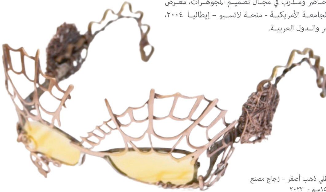
نظارة فانتازيا - نحاس أحمر مطلي ذهب أصفر - زجاج مصنع - لون أصفر - ١٥سم - ٢٠٢٣

مدير قسم التصميم بشركة كبرى للمجوهرات، فنان حلي معاصر فائز بجائزة مسابقة الإبداع الحر لتصميم الحلي ٢٠٠٦ فئة طاقم العروس، شاركت في صالون الشباب الرابع عشر - السادس عشر ومهرجان فن الحلي الدورة الثانية- الدورة الرابعة محاضر ومدرب في مجال تصميم المجوهرات، معرض جماعي (حلي النيل) بالجامعة الأمريكية - منحة لاتسيو - إيطاليا ٢٠٠٤، لديه مقتنيات فنية بمصر والدول العربية.