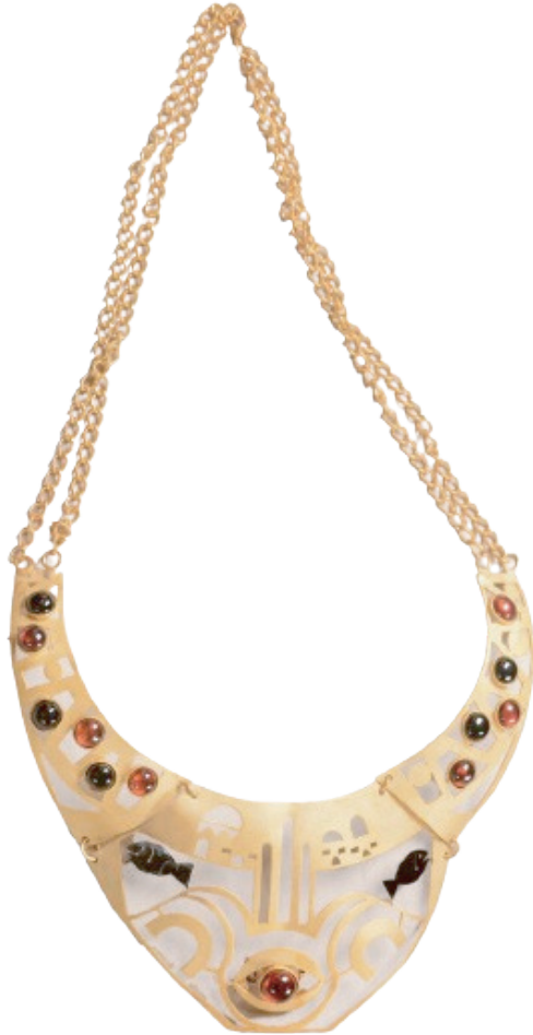
نحاس مطلي ذهب - ٩٠×٤٥سم بالإخراج - ٢٠٢٢

مواليد القاهرة ، ماجستير في الفنون التشكيلية الشعبية ٢٠٢١، إخصائي فنون تشكيلية في الهيئة العامة لقصور الثقافة - وزارة الثقافة المصرية، شاركت في معرض صالون الشباب الإقليمي بإقليم القاهرة الكبرى ٢٠١٦، ٢٠١٧، معرض صالون الشباب الإقليمي بإقليم القاهرة الكبرى ٢٠١٩ ، معرض ومسابقة إبداعاتهن للفنانات التشكيليات بالمجلس الأعلى للثقافة بدار الأوبرا ٢٠٢٠، معرض الفنون التشكيلية بمناسبة احتفال وزارة الثقافة بانتصارات أكتوبر المجيدة بمركز إبداع طلعت حرب الثقافي التابع لصندوق التنمية الثقافية ٢٠٢١، مهرجان ضي للشباب العربي الرابع ٢٠٢٢، معرض خاص بمركز رامتان الثقافي -متحف طه حسين-قطاع الفنون التشكيلية ووزارة الثقافة ٢٠٢٢، معرض أيام الشارقة التراثية- في دورتها العشرين ٢٠٢٣ تحت شعار « التراث والإبداع» معهد الشارقة للتراث بحكومة الشارقة بدولة الإمارات، معرض خاص بقاعة آدم حنين بدار الأوبرا المصرية ٢٠٢٣ .