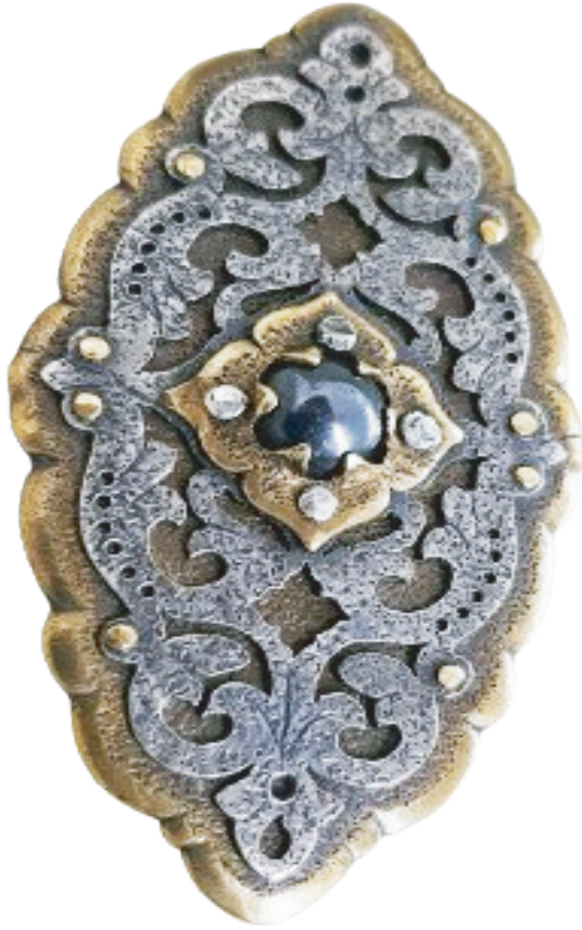
خاتم فضة عيار ٩٢٥- النحاس الأصفر المجدد - حجر الهيما تايت - ٣,٧ × ٦,٥ سم - ٢٠٢٣

بكالوريوس الفنون الجميلة- قسم ديكور- عماره داخلية ١٩٩٢، عملت في مجال التصميم الداخلي والأثاث - بالأخص تصميمات ذات الطابع التراثي الإسلامي- على مدار ٢٥ عامًا، مصممة ومنفذة حلي، احترفت العمل بمجال الحلي لشغفها به، منذ سبعة أعوام، دبلومة صناعة الحلي بمركز تكنولوجيا الحلي -التابع لوزارة التجارة والصناعة، شاركت بعدة معارض جماعية منها : مهرجان فن الحلي-الدورة الرابعة -٢٠٢٠، معرض حاضنة الصناعات الإبداعية-حاضنة تفتانين ٢ - بقصرعابدين ٢٠٢٢، معرض القاهرة الدولي السابع للابتكار ٢٠٢٣، نالت المركز السادس بمسابقة تصميم الحلي والمجوهرات التي أطلقها معرض نبيو للذهب ومدرسة عزه فهمي- الدورة الأولى-٢٠٢٢.