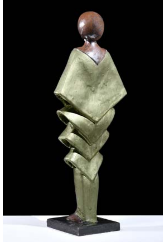
( عروسة من المستقبل ) - نحت خزفي مزيج بالاختزال داخل الفرن - ( ٤٥ سم طول × ٣٥ سم عرض × ١٥ سم سمك بالتقريب ) ٢٠٢١