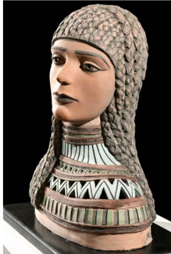
( عروسة النيل ) - نحت فخاري ملون بالبطانات Terracotta - ( ٥٠ سم طول × ٦٠ سم عرض × ١٥ سم سمك بالتقريب ) ٢٠٢١