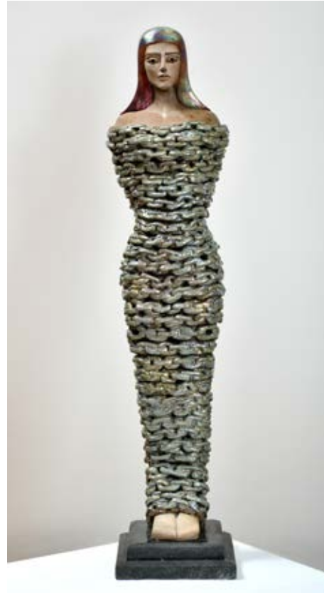
( قيود ) - نحت خزفي مزجج بالاختزال داخل الفرن ( ٨٠سم طول × ١٠ سم عرض × ٧ سم سمك بالتقريب ) ٢٠٢٢