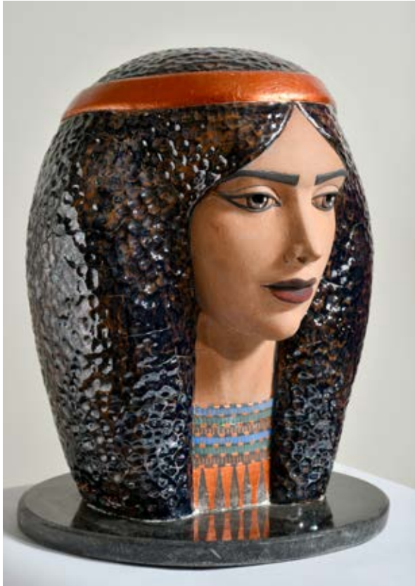
( الملكة ) - نحت خزفي مزجج بالبريق المعدني في جو حريق مؤكسد ( ٧٠سم طول × ٥٠ سم قطر بالتقريب ) ٢٠٢٢