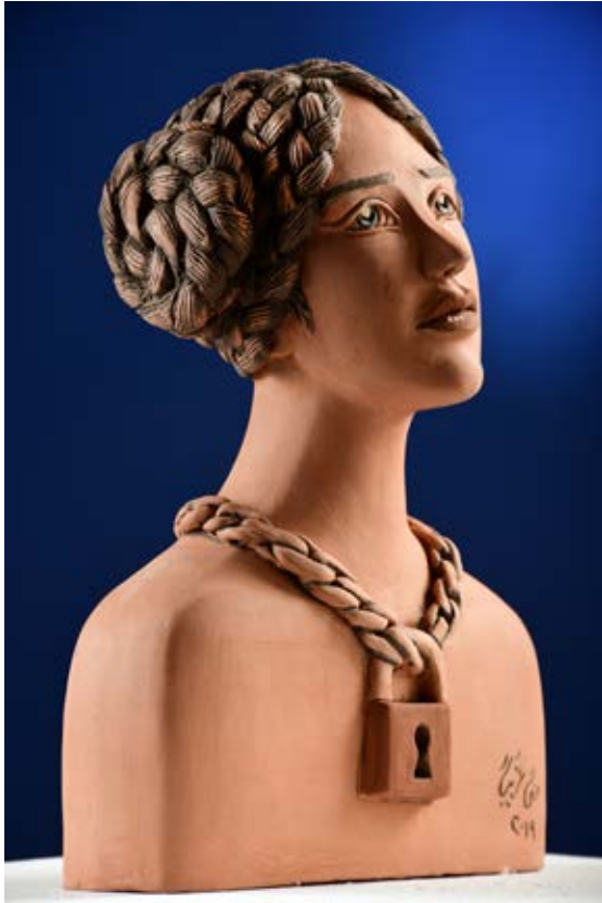
ملكة بطوق العبيد ) - نحت فخاري ملون بالبطانات Terracotta ( ارتفاع ٥٠ سم × عرض ٣٥ سم × سمك ١٥ سم ) ٢٠١٩