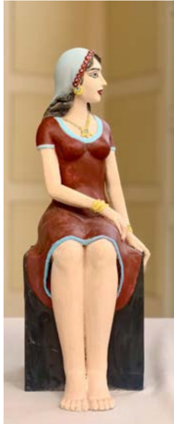
(بنت إسكندرية) - نحت فخاري ملون