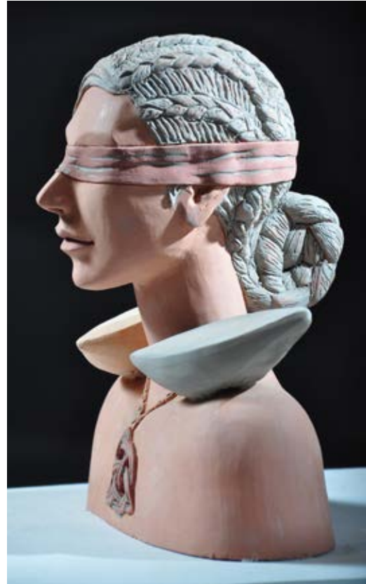
( الحياة والموت ) - نحت فخاري ملون بالبطانات Terracotta