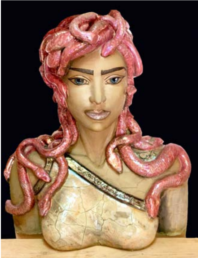
( المظلومة ) - نحت خزفي مزيج بالاختزال داخل القرن ٧٠ سم طول × ٤٠ سم عرض ( ٢٠٢٣ )