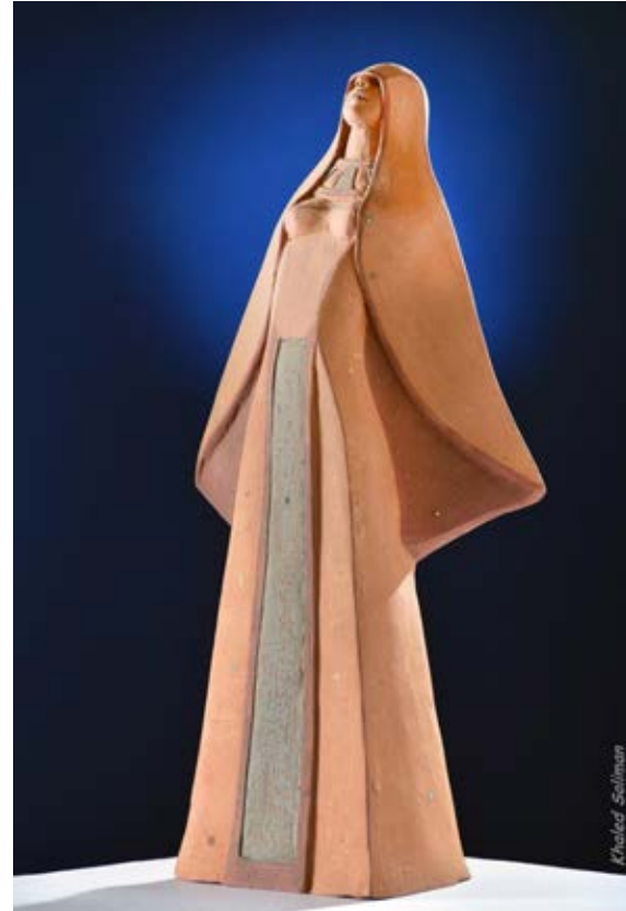
( أطلق سراحي ) - فخار ملون بالبطانات Terracotta ٥٠ سم طول × ١٢ سم عرض ( ٢٠١٧ )