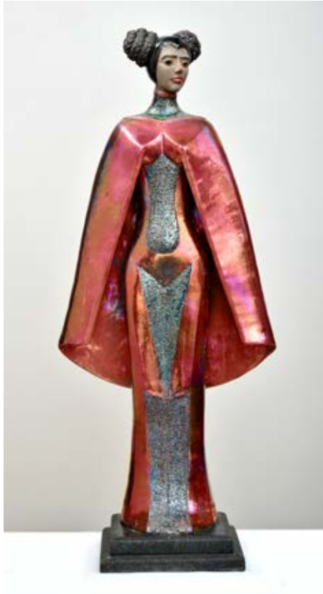
( تَاهب ) - نحت خزفي مزجج بالاختزال داخل الفرن ( ٨٥ سم طول × ٣٥ سم عرض × ١٠ سم سمك بالتقريب ) ٢٠٢٢