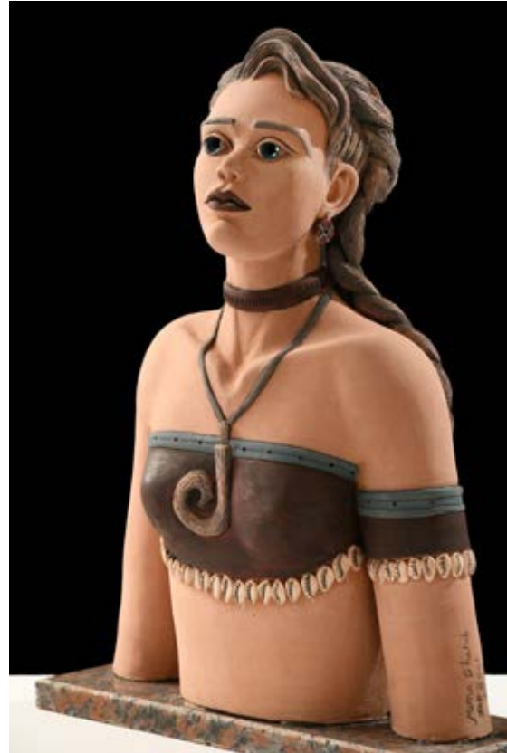
مستعدة للقتال ) - نحت فخاري ملون بالبطانات Terracotta ( ٥٥ سم طول × ٥٠ سم عرض × ٢٠ سم سمك بالتقريب ) ٢٠٢٠