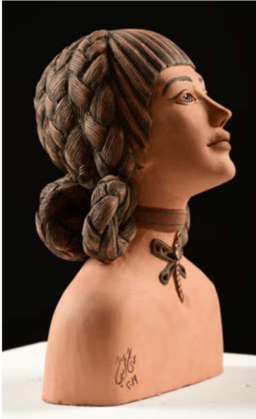
(اليحسوب) - نحت فخاري ملون بالبطانات Terracotta (٤٠ سم طول × ٣٥ سم عرض × ١٠ سم عمق بالتقريب) ٢٠١٩