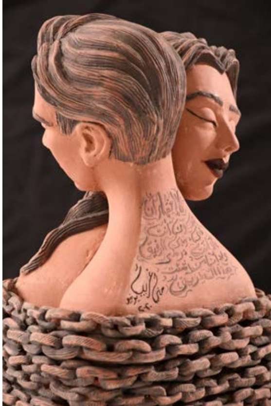
( لا مفر ) - نحت فخاري ملون بالبطانات Terracotta ( ٢٠٢٠م عمق بالتقريب ) ٣٥سم طول × ٢٥سم عرض × ١٠سم عمق