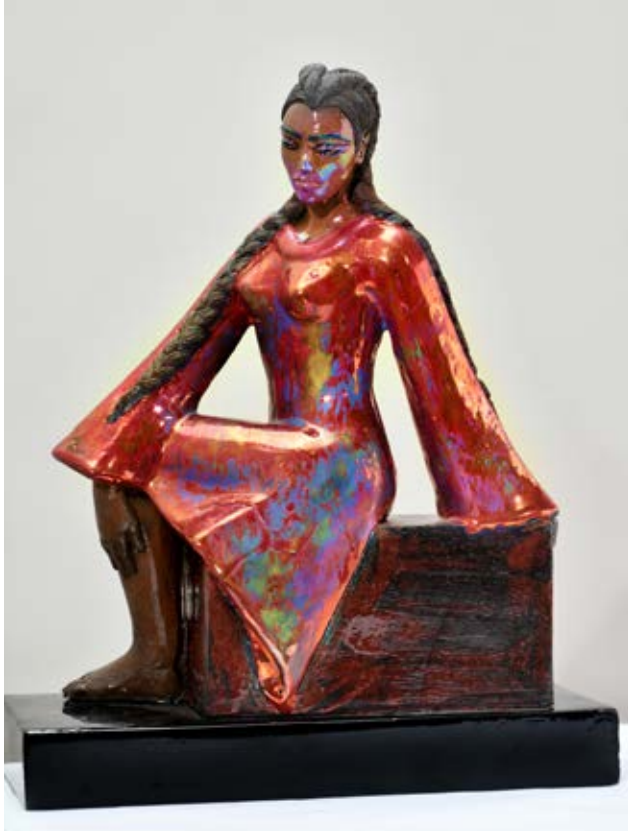
( نهوض ) - نحت خزفي مزيج بالاختزال داخل الفرن ( ٤٠سم طول × ٤٠سم عرض × ٢٥سم سمك بالتقريب ) ٢٠٢٢