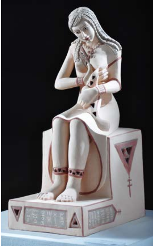
( أنا الحياة ) - فخار ملون بالبطانات ٢٠١٧ ( ٧٠ سم طول × ٤٠ سم عرض )