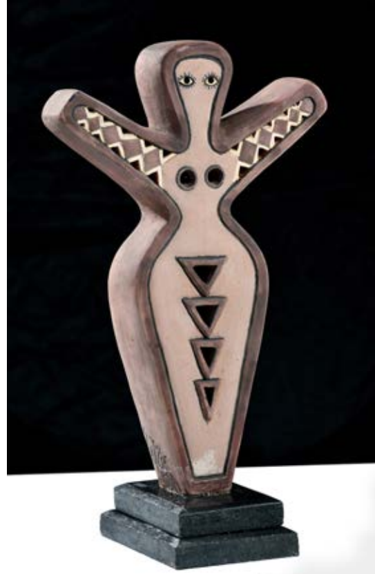
( عروسة الحسد ) - نحت فخاري ملون بالبطانات Terracotta - ( ٣٥ سم طول ٢٠× سم عرض ٨× سم سمك بالتقريب ) ٢٠٢١