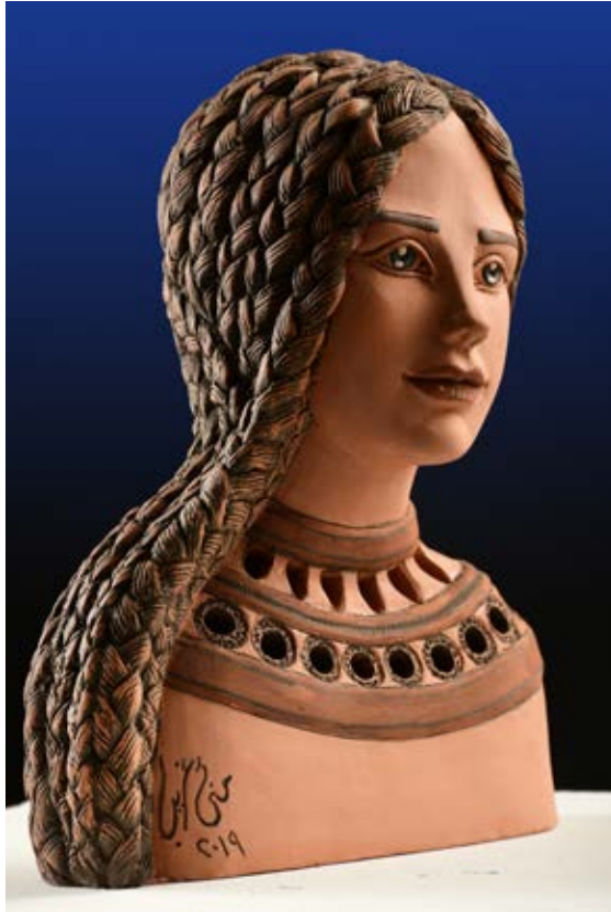
( نظرة ) - نحت فخاري ملون بالبطانات Terracotta ( ٥٠ سم طول × ٣٥ سم عرض × ١٥ سم عمق بالتقريب ) ٢٠٢٠