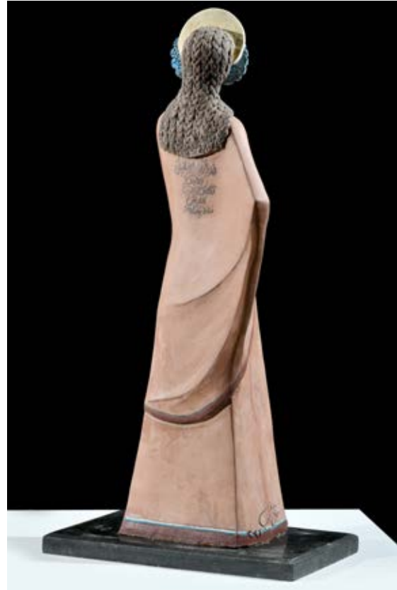
( عروسة من الماضي ) - نحت فخاري ملون بالبطانات Terracotta - ( ٤٥ سم طول × ٣٠ سم عرض × ٢٠ سم سمك بالتقريب ) ٢٠٢١