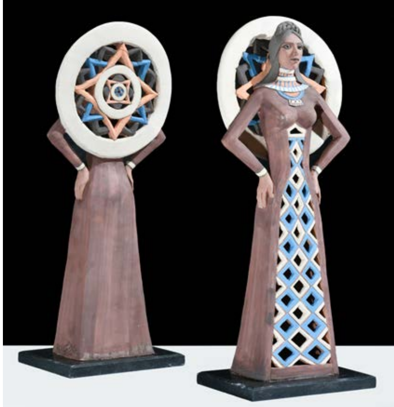
( عروسة المولد ) - نحت فخاري ملون بالبطانات Terracotta - ( ٥٠ سم طول × ٣٥ سم عرض × ١٥ سم سمك بالتقريب ) ٢٠٢١