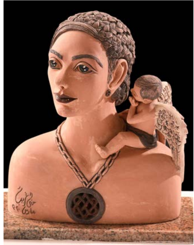
( همسة ) - نحت فخاري ملون بالبطانات Terracotta ( ٤٥ سم طول ، ٣٠ سم عرض ، ١٠ سم عمق بالتقريب ) ٢٠٢٠