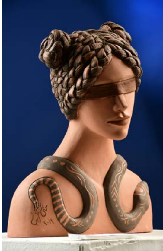
( الخروج ) - نحت فخاري ملون بالبطانات Terracotta (٤٥ سم طول × ٣٥ سم عرض × ١٠ سم عمق بالتقريب ) ٢٠١٩