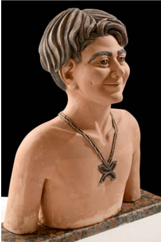
(ابتسامة أمل) - نحت فخاري ملون بالبطانات Terracotta ( ٤٥سم طول × ٥٠سم عرض × ٢٠سم سمك بالتقريب ) ٢٠٢٠