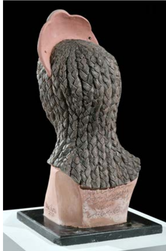
(عروسة النيل بتاج ) - نحت فخاري ملون بالبطانات Terracotta - ( ٥٠ سم طول × ٤٠ سم عرض × ٣٥ سم سمك بالتقريب ) ٢٠٢١