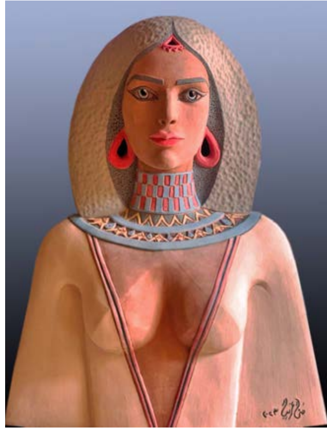
( الملكة ) - نحت فخاري ملون بالبطانات والأكاسيد الملونة Terracotta ٧٠ سم طول × ٥٥ سم عرض ( ٢٠٢٣ )