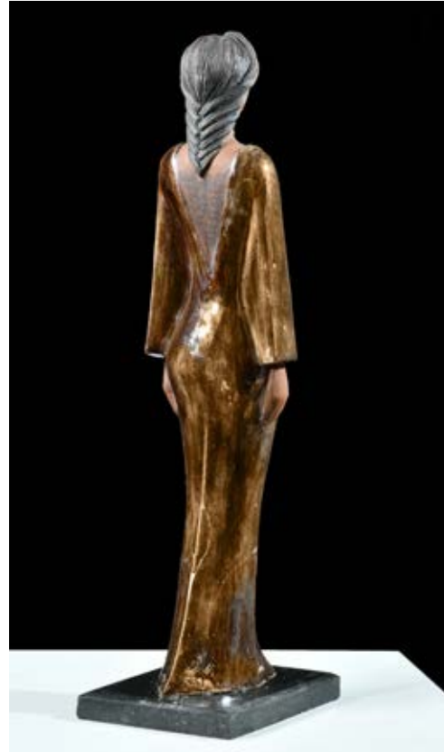
(عروسة من الحاضر) - نحت خزفي مزيج بالاختزال داخل الفرن - (٤٥سم طول × ١٥سم عرض × ١٠سم سمك بالتقريب) (٢٠٢١)