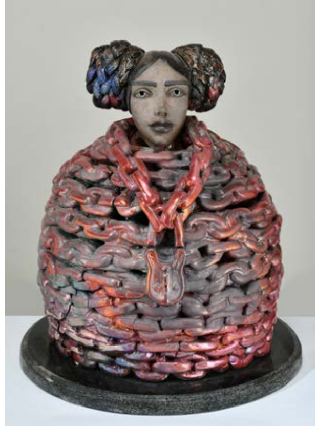
( قيود محكمة ) - نحت خزفي مزيج بالاختزال داخل الفرن ( ٤٠سم طول × ٣٠سم عرض × ٣٠سم سمك بالتقريب ) ٢٠٢٢