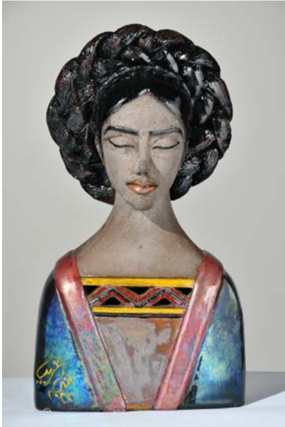
( داخل نفسي ) - نحت خزفي مزجج بالاختزال داخل الفرن ( ٣٥سم طول × ٢٥ سم عرض × ٨ سم سمك بالتقريب ) ٢٠٢٢