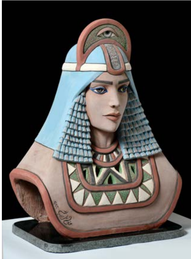
( الملكة ) - ملون بالبطانات والأكاسيد الملونة ٢٠٢٢ سم عرض ( ٧٠ سم طول × ٤٠ سم عرض )