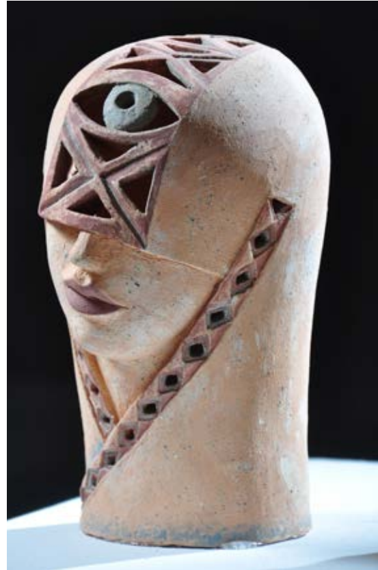
( عين البصيرة ) - فخار ملون بالبطانات - Terracotta ٢٠١٥ ( ٢٥ سم طول × ١٠ سم قطر )