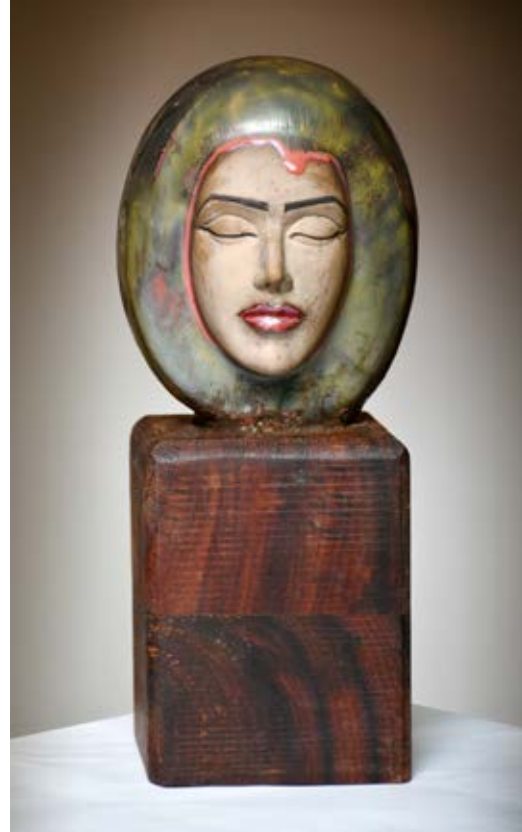
( تأمل ) - نحت خزفي مزجج بالاختزال داخل الفرن ( ٣٠ سم طول × ١٠ سم عرض × ١٠ سم سمك بالتقريب ) ٢٠٢٢