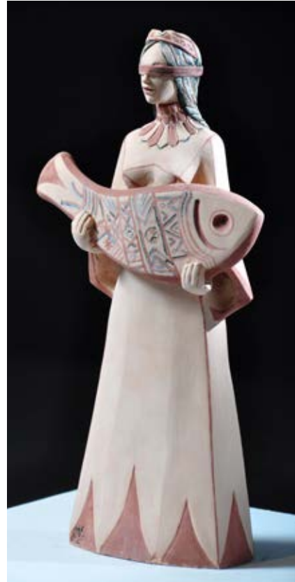
( الخير ) - فخار ملون بالبطانات ٢٠١٧ سم عرض ( ٣٥ سم طول × ١٥ سم عرض )