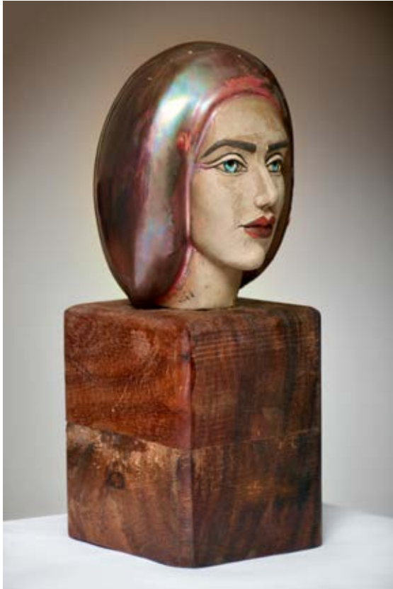
( نظرة ) - نحت خزفي مزجج بالاختزال داخل الفرن ( ٣٠ سم طول × ١٥ سم عرض × ١٠ سم سمك بالتقريب ) ٢٠٢٢