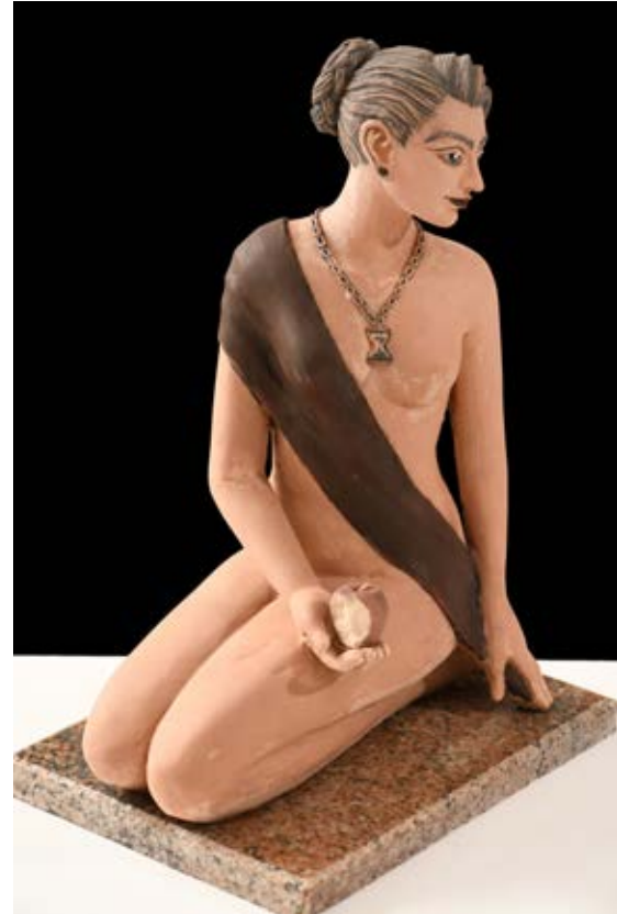
( جنة جديدة ) - نحت فخاري ملون بالبطانات Terracotta ( ٣٠سم طول × ١٥سم عرض × ٢٠سم عمق بالتقريب ) ٢٠٢٠