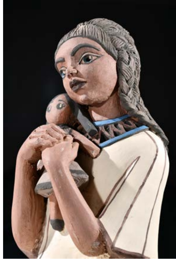
(عروسة لعبة) - نحت فخاري ملون بالبطانات Terracotta - ( ٣٥ سم طول × ٢٨ سم عرض × ٢٥ سم سمك بالتقريب ) ٢٠٢١