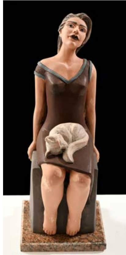
( انتظار ) - نحت فخاري ملون بالبطانات Terracotta ( ٣٠ سم طول × ١٥ سم عرض × ١٥ سم عمق بالتقريب ) ٢٠٢٠