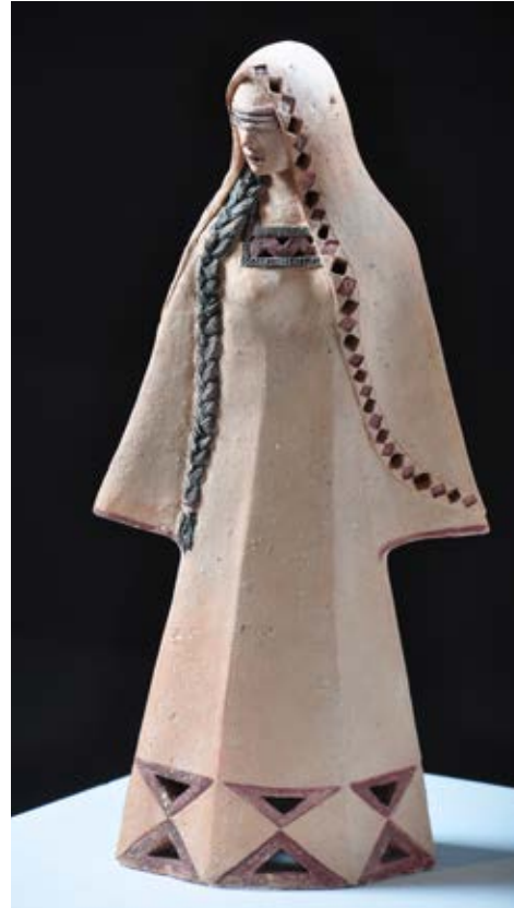
(الغولة) - فخار ملون بالبطانات - طين سيوة (٤٠ سم طول × ٢٠ سم عرض × ٨ سم عمق بالتقريب) ٢٠١٣