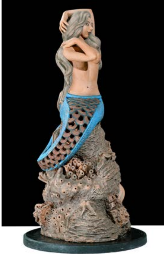
( عروسة البحر ) - نحت فخاري ملون بالبطانات Terracotta ٦٠ سم طول × ٥٥ سم عرض × ٤٥ سم سمك بالتقريب ( ٢٠٢١ )