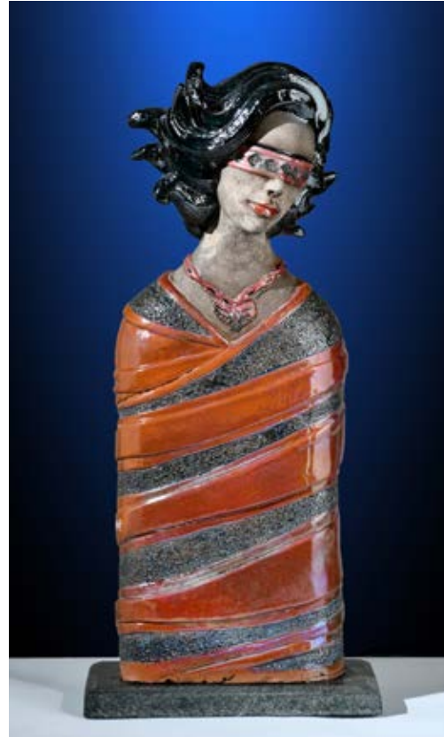
( انطلاق ) - نحت خزفي مزجج بالاختزال داخل الفرن ( ٤٥ سم طول × ١٥ سم عرض × ٨ سم سمك بالتقريب ) ٢٠٢٢