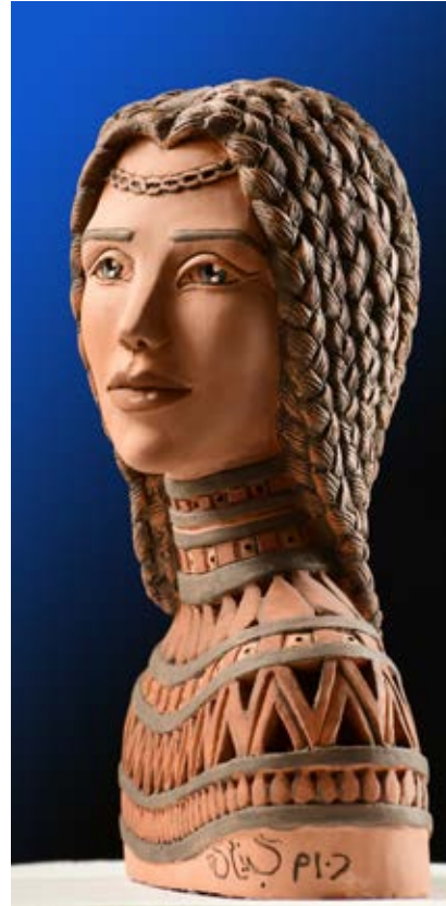
( تَطَّلِع ) - نحت فخاري ملون بالبطانات Terracotta (٤٠ سم طول × ٣٥ سم عرض × ١٠ سم عمق بالتقريب ) ٢٠١٩