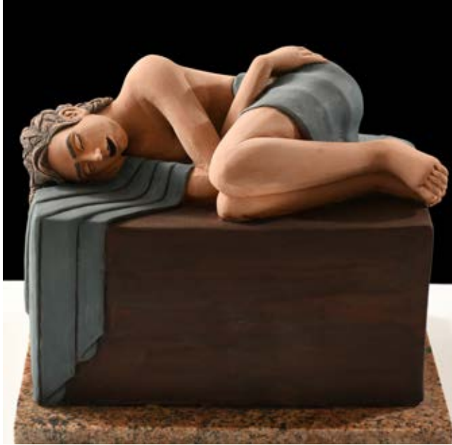
( الهدية ) - نحت فخاري ملون بالبطانات Terracotta ٢٥ سم طول × ٣٠ سم عرض × ١٥ سم عمق بالتقريب ( ٢٠٢٠ )