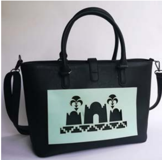
تصور لحقيبة يد

تصور لحقيبة أغراض بتقنية القطع بالليزر مع مزج القماش بالجلد