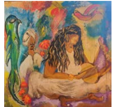
عمل مكون من ٩ أجزاء كل لوحة بمقاس ٣٥ x ٥٠ ١٥٠ x ١٥٠