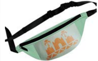
تصور لحقيبة بتقنية حفر بالليزر