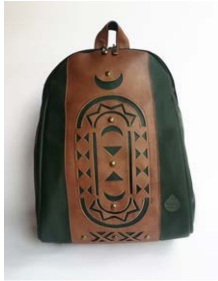
حقيبة ظهر من الجلد بتقنية القطع بالليزر